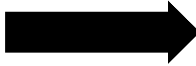
国家資格の実技練習②