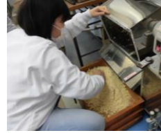
国家試験の実技練習①